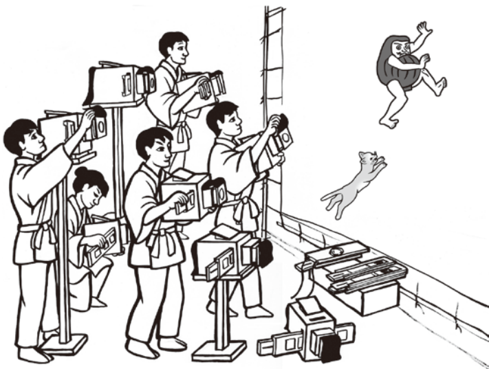
舞台裏で写し絵を操作する様子

この絵では、七台の「風呂」を使っています。小さな景色を映し、それを合わせて大画面を構成するという、西欧にはない独創的な画面構成をしています。又、「風呂」を手に持つことで、投影された人物を自在に動かすことができ、より表現豊かな芸能へと高めることができました。