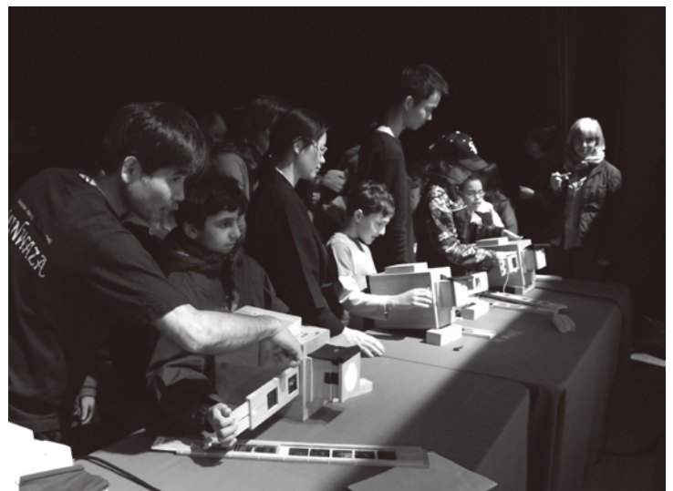
舞台裏で写し絵を体験する子ども達の様子

〒152-0001 東京都目黒区中央町1-15-21 TEL 03-3710-1061 FAX 03-3710-1408