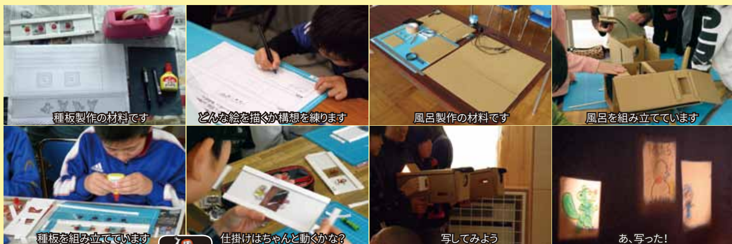
種板製作の材料です